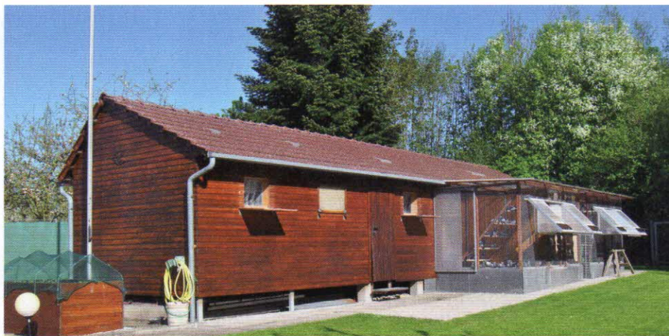
Der wunderschöne Taubenschlag besteht aus zwei Witwerschlägen mit 19 und 15 Zellen links neben der Eingangstür und einem Witwerschlag mit 12 Zellen rechts neben der Eingangstür.

1. Kl. I Vögel (Standardvogel) 1. Kl. Weibchen jährlich 2. Kl. Elite Weibchen 2. Kl. I Weibchen 1. Gesamtsieger